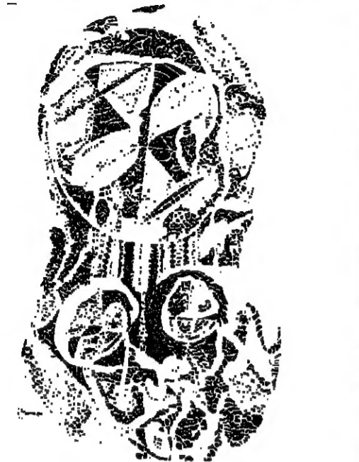
من رسوما المسارلة الى باريس